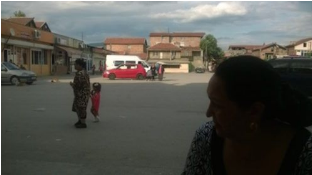
На площада в кв. „Надежда“ в Сливен

Визирайки и двете групи, този двойствен език успява да се трансформира в парадоксална заповед за ромите от средната класа, които, каквото и да стане, знаят, че ще си останат винаги роми.