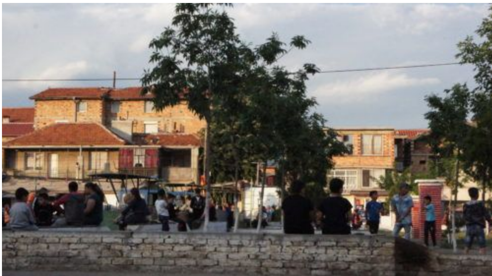
На площад „Надежда“ в Сливен