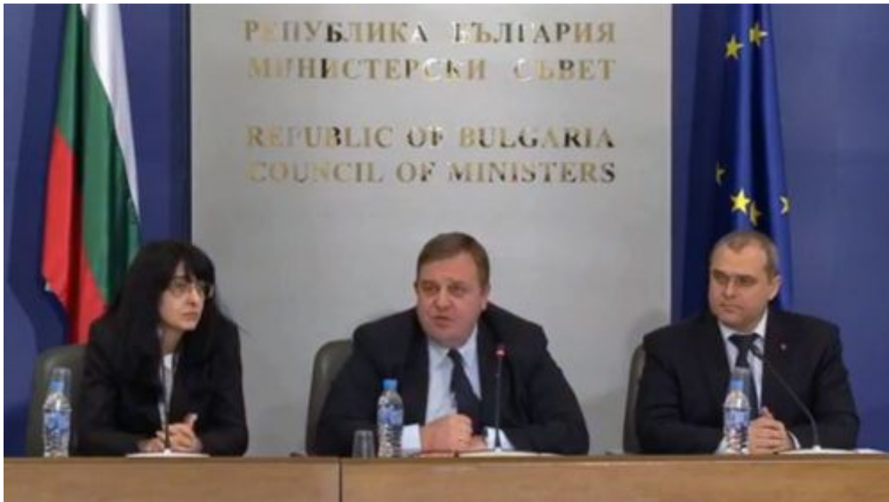
Пресконференция на Красимир Каракачанов в Министерския съвет

След 1989 г. множество планове за действие и програми са били изрично насочени към ромското население. Първият текст датира от 22 април 1999 г., но е замислен и разработен още през 1997 г. Предвидена е институция 1 към правителството, която да се занимава с етническите въпроси. Тя обаче е остро критикувана и вероятно не разполага нито с видимост, нито с правомощия.