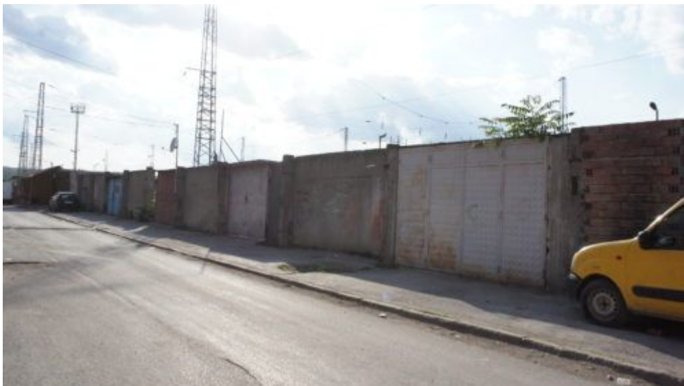
Стената в квартала „Надежда“ в Сливен