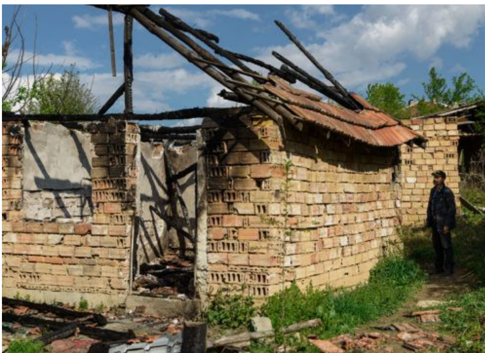
Изгорена ромска къща в Габрово

Въпросът не е дали този текст ще влезе в сила утре или след пет години; чрез самата си форма той има силата да действа, което подстрекава още повече в българското общество открито расистки прояви и рискува те да станат масови. Ще се опитаме да покажем как този текст подкрепя небивалото засилване на дискриминацията в България. Неотдавнашните събития в Габрово го потвърждават.